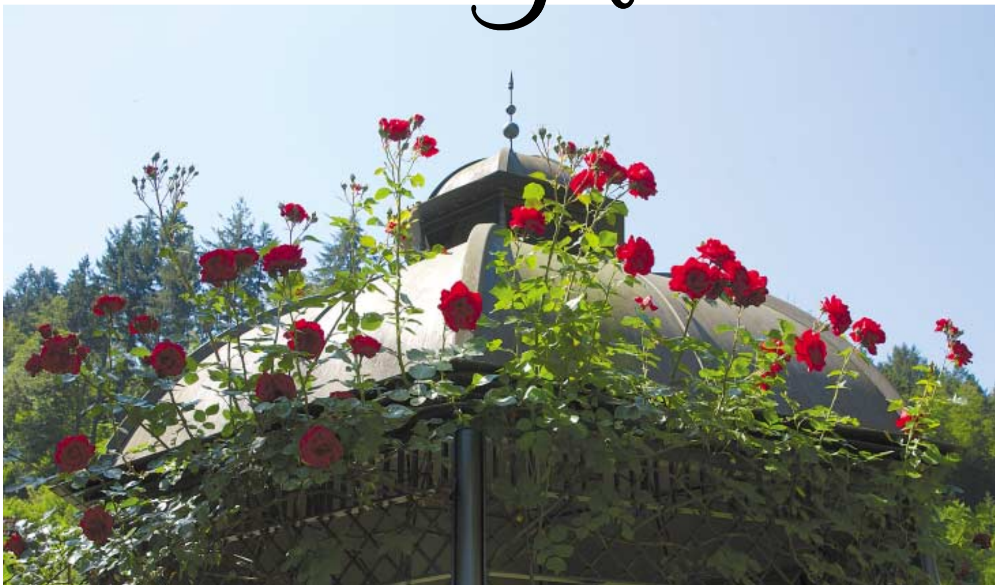
Unser Pavillon im Kurpark hat sich mit Rosenblüten für den Sommer geschmückt.